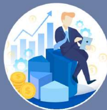
Optimalisasi Ekosistem Bisnis