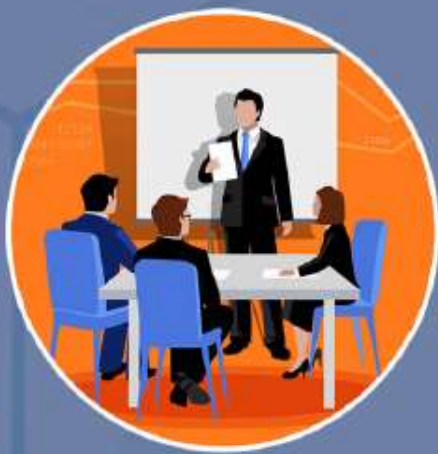
Mengubah Layanan Publik

“Transformasi Digital untuk keberlanjutan dan pertumbuhan ekonomi yang adil, serta untuk meningkatkan kualitas kehidupan sosial dan lingkungan”